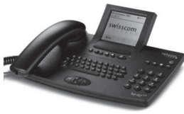
Top A57 ISDN

Ein ISDN Telefon hat im Gegensatz zu einem Analogtelefon zwei Eingangsübertrager mit Mittelanzapfung für die Speisung, einen Umschalter für die Notschaltung, einen S-Baustein, den D-Kanal-Controller und eine Schnittstelle zum PC.